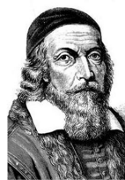
Jan Amos Komenský